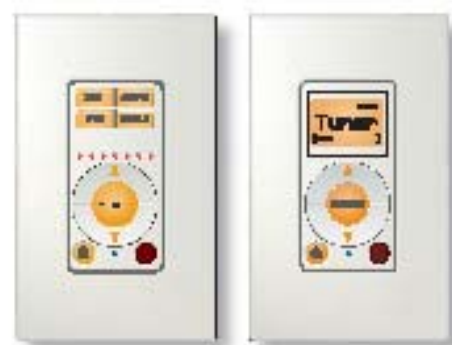
Klawiatury sterujące: KP4, KPL

*Uwaga! Wzmacniacz CAS44 nie może być podłączony z CAA66 dla 10 strefowego systemu nagłośnienia.